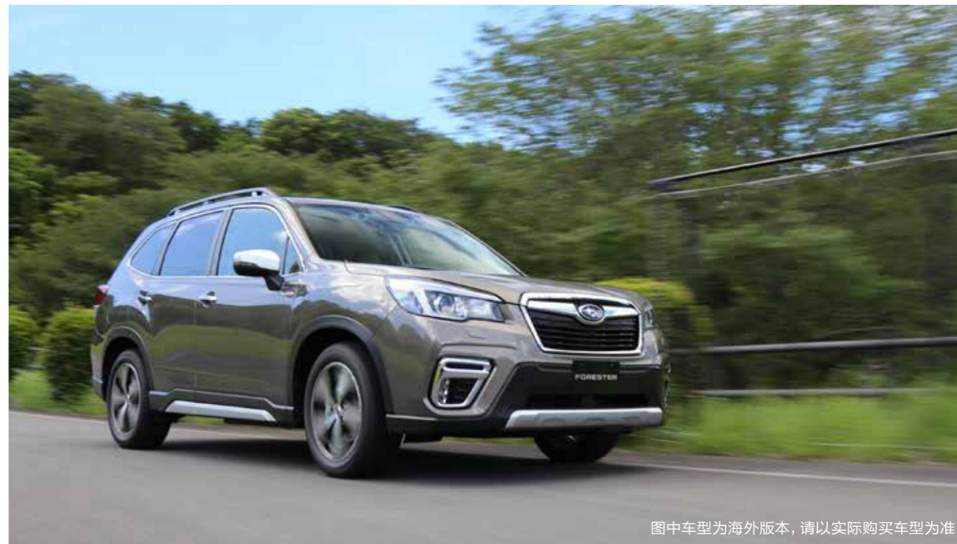
图中车型为海外版本，请以实际购买车型为准

如今新一代FORESTER森林人在国内正式上市，而前不久在日本伊豆，我有幸与“五代目”森林人有了一次亲密的接触，借上市之际，让我们来审视一遍这款全新换代的产品究竟如何。