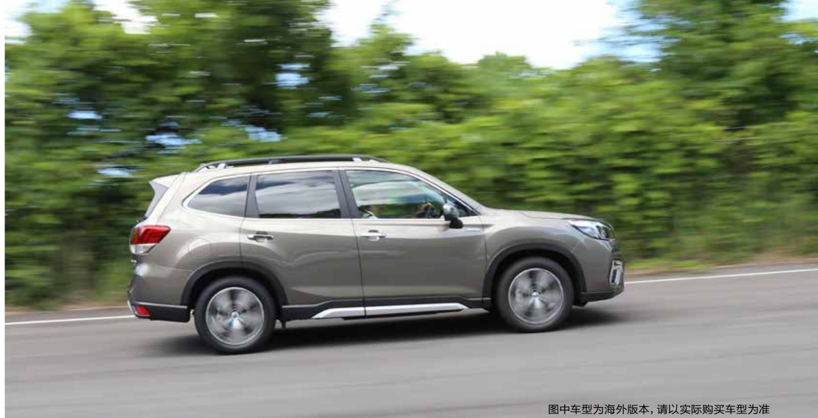
图中车型为海外版本，请以实际购买车型为准

在排放法规、研发理念的硬指标限制下，第五代产品依旧实现了质的提升，而在我看来，当你开动它的时候，你会发现这个品牌的DNA还在，这种DNA就是——嗯，开着还是一台斯巴鲁。至于森林人，我觉得，经过五代已完全成为独立车系的它，全新的第五代产品是称职的。