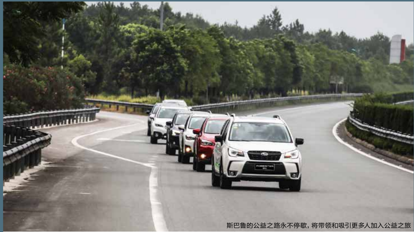
斯巴鲁的公益之路永不停歇，将带领和吸引更多人加入公益之旅

本次活动的成功举办让所有参与者在贴近自然、领略生态和谐之美的过程中，体会到绿色生态与现代人文和谐发展的重要性。与此同时，斯巴鲁还将坚持生态保护公益之路，以优质的汽车产品和服务为纽带，帮助更多人了解和认识中国自然生态状况，号召人们为保护生态共同努力。接下来，斯巴鲁第六季“31座森林星之旅”还将继续展开，希望更多人能够加入进来，与斯巴鲁携手，为中国的自然生态保护贡献力量。