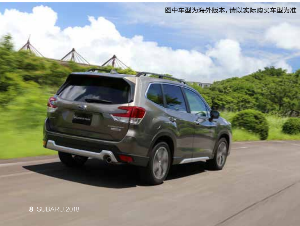
图中车型为海外版本，请以实际购买车型为准