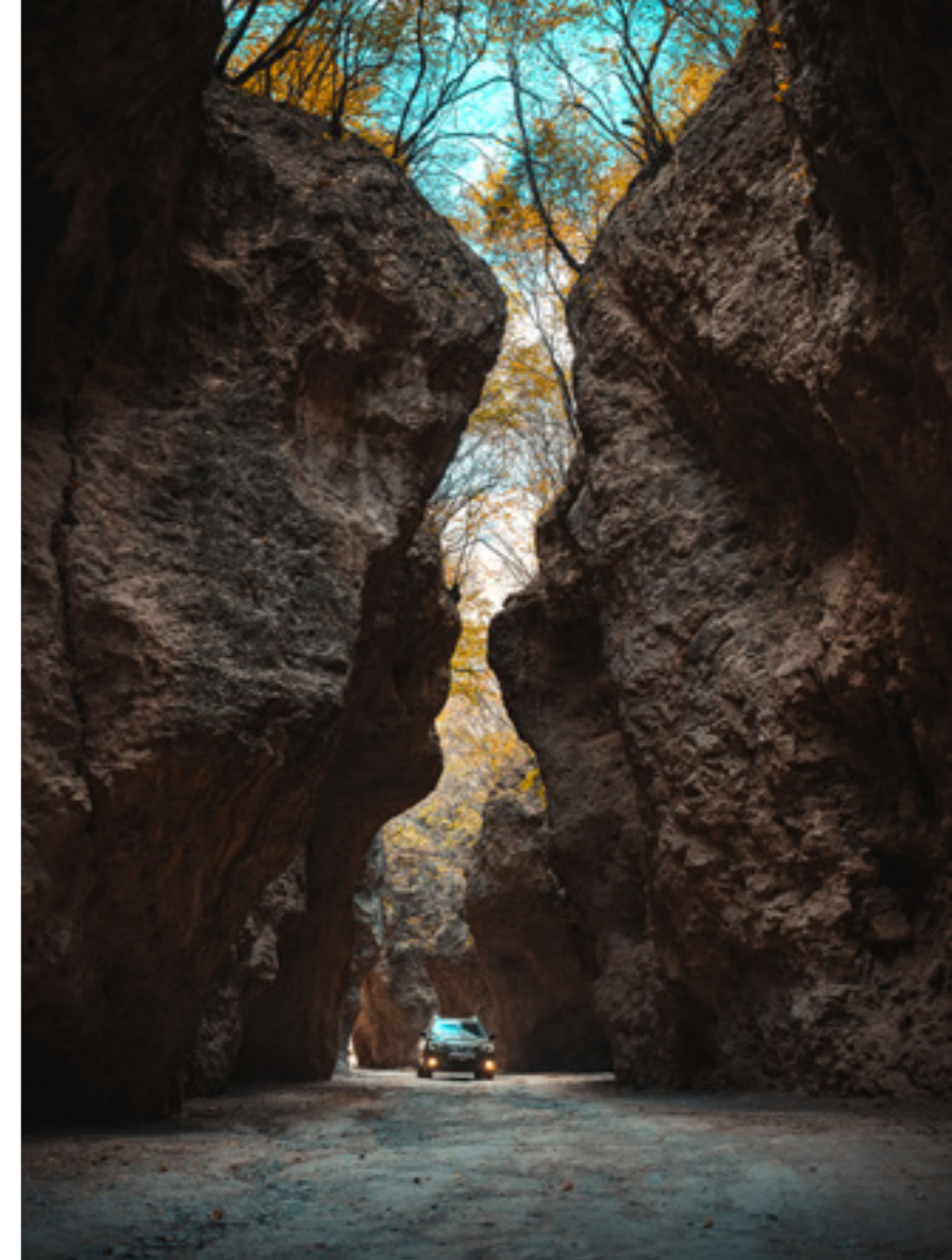
爨底下村有一处名为“一线天”的景点，是一道天然关隘，裂谷长达100多米，景观十分奇特，有着“天险”之称。

爨底下村近些年大力发展旅游业，若是周末前来，总是车满为患，哪怕我们特意选择了工作日来到这里，旅行者依然络绎不绝。把车停好后，步行进入村子，映入眼帘的是一片干净整洁，白墙灰瓦，以及随处可见的带有“爨”字的影背墙，是旅客们的打卡圣地。