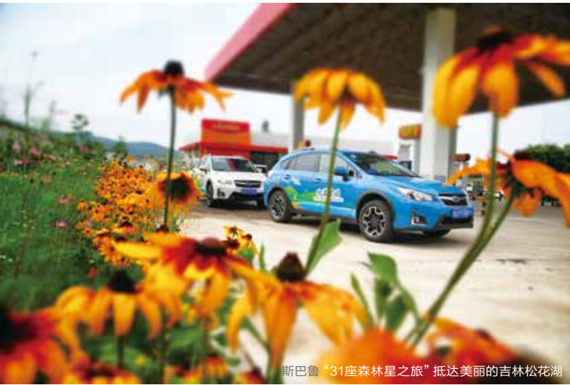
斯巴鲁“31座森林星之旅”抵达美丽的吉林松花湖