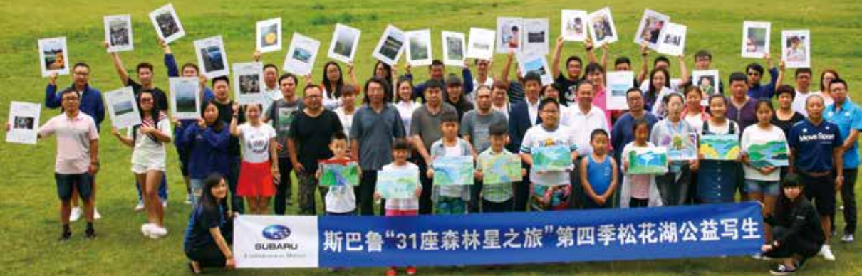
画家与孩子们展示在吉林松花湖完成的写生作品

本次首站活动的举办地松花湖位于吉林省东南部的三湖国家级自然保护区之内，这里动植物种类繁多，森林覆盖率达71%，是一处以保护森林生态和水资源为主的国家级综合性保护区。