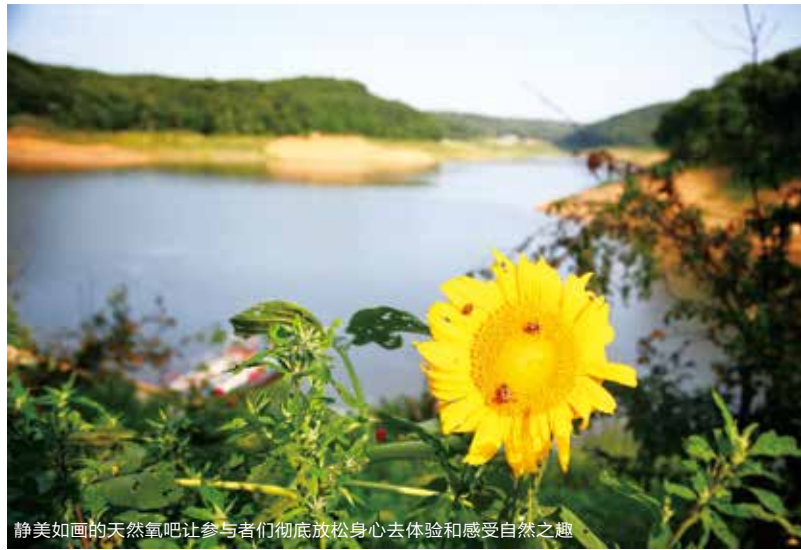
静美如画的天然氧吧让参与者彻底放松身心去体验和感受自然之趣