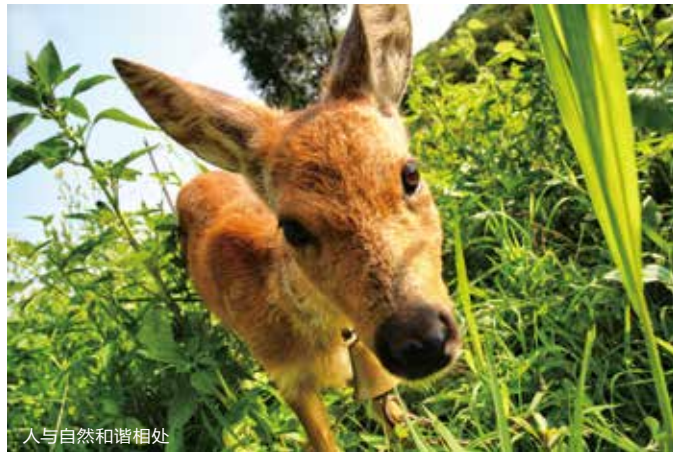
人与自然和谐相处