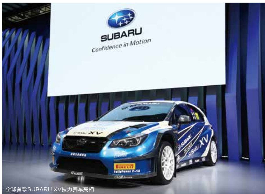
全球首款SUBARU XV拉力赛车亮相

此次参展，斯巴鲁以精品代表车型以及全球首款SUBARU XV拉力赛车向所有到场观众展现了全时四驱车型的独特魅力所在。而斯巴鲁也将继续立足市场需求，不断推出融会技术创新和设计理念创新的车型，帮助中国消费者享受更为精彩的有车生活方式。