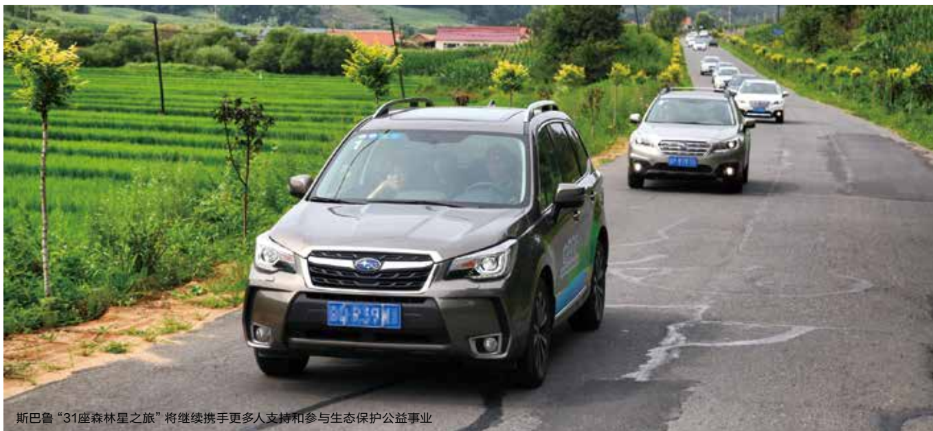
斯巴鲁“31座森林星之旅”将继续携手更多人支持和参与生态保护公益事业

触自然，纯美自然之趣以及丰富而充实的活动内容给大家尤其是少年儿童留下了深刻印象，实现了提升民众绿色森林生态保护意识的目的。接下来，第四季“31座森林星之旅”将继续开展“寻找中国生态英雄”和“发现森林文化小镇”活动，斯巴鲁期待中国消费者能够持续关注这一绿色行动并积极参与进来，携手筑梦绿色中国。