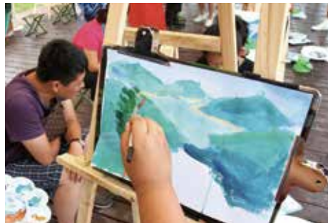
在画家带领下，孩子们在山顶俯瞰松花湖，让青山秀水定格在画板上

座森林星之旅”紧密结合“森林中国”设置了三大主题活动内容：7月“绘美家园公益系列活动”，到自然保护区写生、慰问一线环保工作者；8月“寻找中国生态英雄”，追寻生态英雄事迹、发起自愿公益行动；9月“发现森林文化小镇”，穿越森林小镇、感受和保护环境。斯巴鲁希望通过这些形式丰富、内容精彩的生态保护公益活动吸引更多人关注生态建设，参与生态保护。