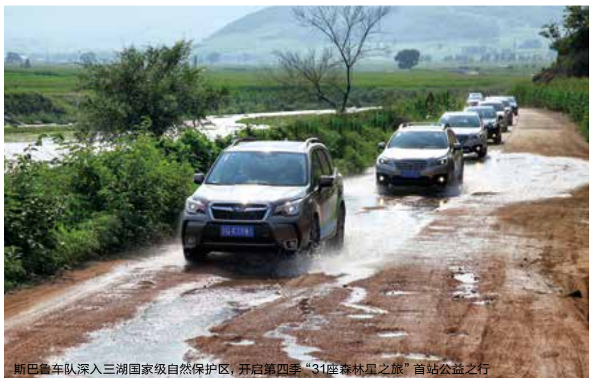
斯巴鲁车队深入三湖国家级自然保护区，开启第四季“31座森林星之旅”首站公益之行

斯巴鲁已连续第四年举办“31座森林星之旅”活动，这一以宣传森林生态保护理念为目的的活动得到了社会各界日益广泛的关注，已成为斯巴鲁品牌助力中国生态保护的重要形象标志。今年，斯巴鲁作为战略公益合作伙伴，继去年之后连续第二年赞助支持由光明日报社、中国林学会、中国光华科技基金会、中国野生动物保护协会等单位联合创建的以森林生态保护为主的大型公益平台——“森林中国”，并将“31座森林星之旅”第四季的活动与这一公益平台紧密结合，扩大活动规模，丰富活动内容，以提升民众生态环境保护意识、促进森林生态保护事业的发展。