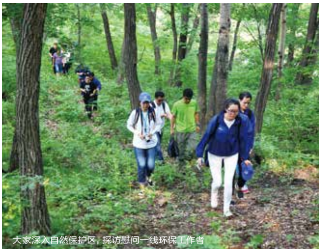
大家深入自然保护区，探访慰问一线环保工作者

活动中，多名画家带领孩子们在美丽的松花湖畔进行了写生，秀美壮阔的景色和丰富的动植物品种，为写生提供了难得的创作素材，也让所有参与者，尤其是孩子们感受到了自然的纯美之趣，并