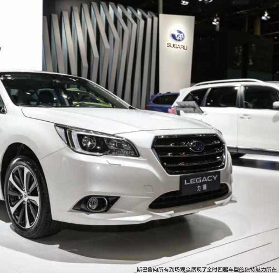
斯巴鲁向所有到场观众展现了全时四驱车型的独特魅力所在