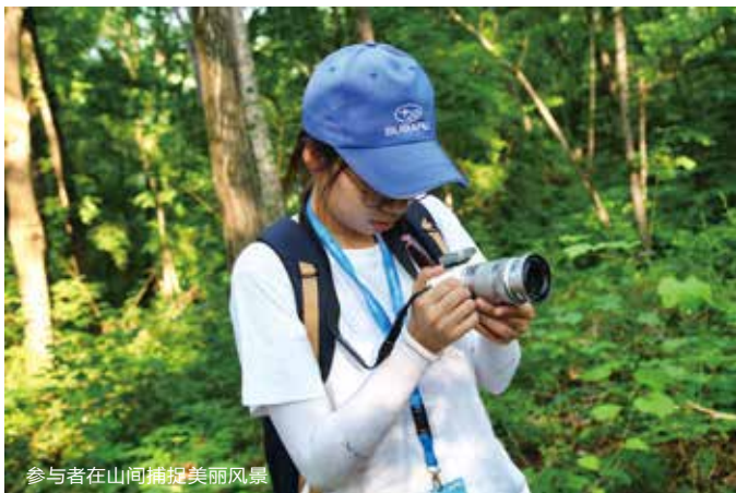
参与者在山间捕捉美丽风景