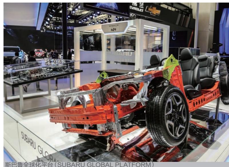
斯巴鲁全球化平台 (SUBARU GLOBAL PLATFORM)

智能水平对置发动机 (INTELLIGENT BOXER) 是斯巴鲁以知名的水平对置发动机为基础,结合电机而成的全新动力组合。斯巴鲁所推出的这一新动力组合继承了水平对置发动机所拥有的“低重心、结构紧凑”的特征,并在此基础上,通过电机辅助使起步及加速更为轻快,同时通过与EyeSight、X-MODE等驾驶辅助系统相协调,使车辆理想兼备“操控乐趣”、“高通过性”和“燃油经济性”。这一全新动力组合