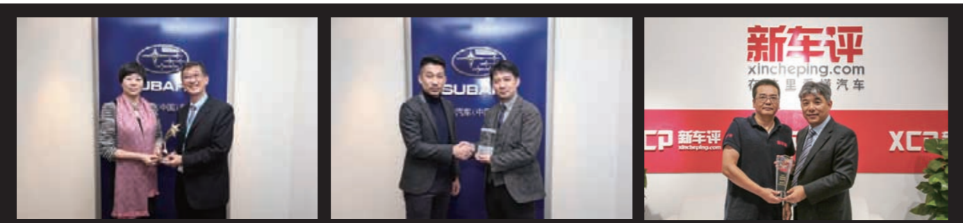
新一代SUBARU XV 在国内频获大奖