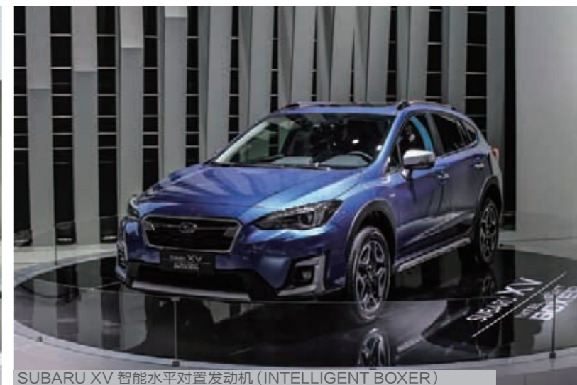
SUBARU XV 智能水平对置发动机 (INTELLIGENT BOXER)