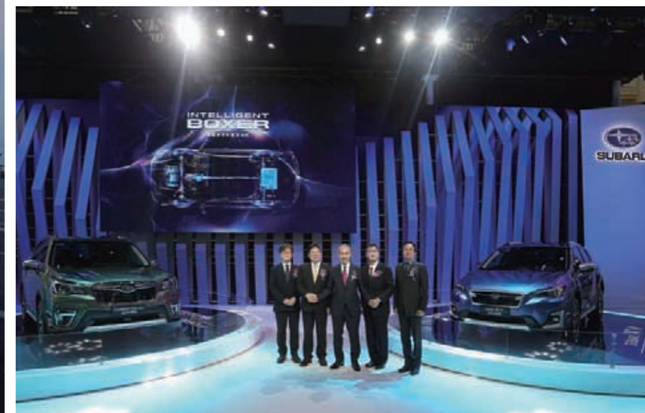
斯巴鲁(中国)领导合影留念