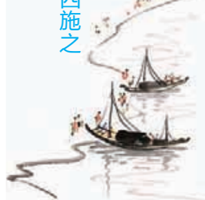
文 \ Teresa

烟波浩渺的太湖，碧波荡漾的鼋头渚，流传着范蠡西施之佳话，也曾历数惠山诗句之名篇，这里是无锡。