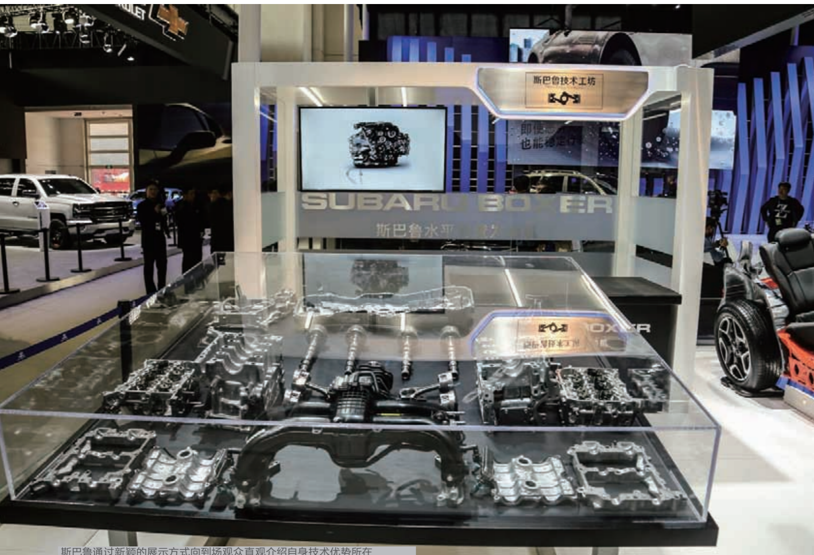
斯巴鲁通过新颖的展示方式向到场观众直观介绍自身技术优势所在