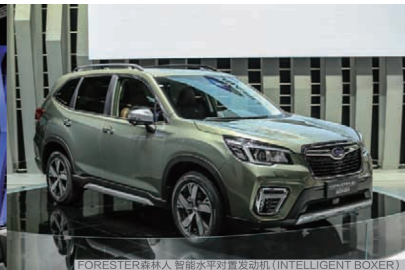
FORESTER森林人 智能水平对置发动机 (INTELLIGENT BOXER)