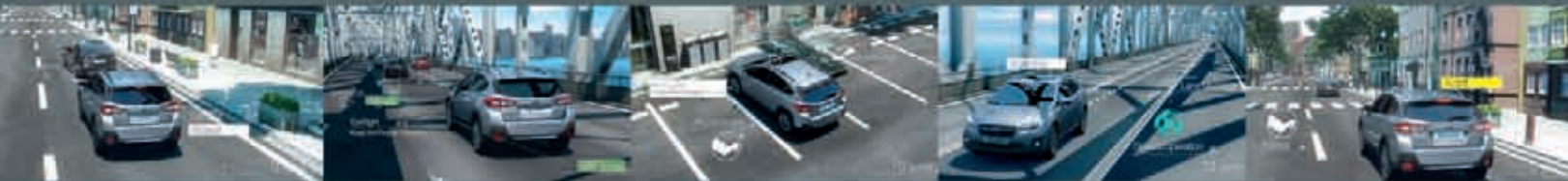
预测危险, 回避碰撞 防撞制动系统(PCB)