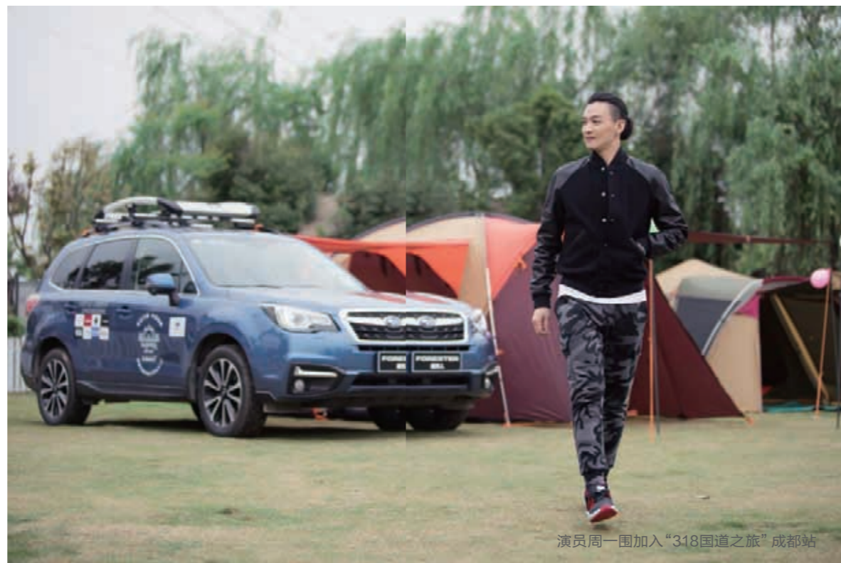
演员周一围加入“318国道之旅”成都站

在天府之国成都，当红演员周一围加入到车队的征程中，与队员们一起露营狂欢，将成都站的活动气氛推向高潮。成都站的精彩活动上，队员们欢欣鼓舞，表达出对之后征服路况艰辛但又美丽卓绝的“川藏南线”的必胜信心。