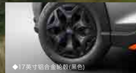
◆17英寸铝合金轮毂(黑色)