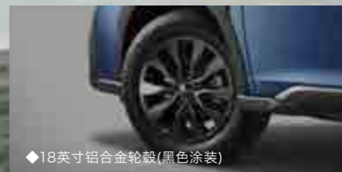
◆18英寸铝合金轮毂(黑色涂装)