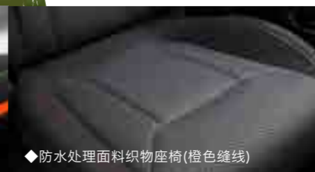
◆防水处理面料织物座椅(橙色缝线)