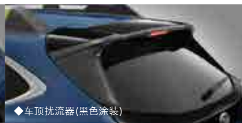
◆车顶扰流器(黑色涂装)