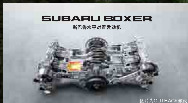
SUBARU BOXER 斯巴鲁水平对置发动机

双目立体摄像头有效掌握道路状况, 必要时进行主动制动, 减轻碰撞伤害。全车速自适应巡航控制系统(ACC)轻松跟车, 让长途旅行更加轻松愉悦。