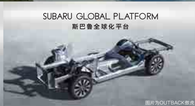
SUBARU GLOBAL PLATFORM 斯巴鲁全球化平台