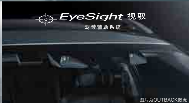
EyeSight 视驭 驾驶辅助系统